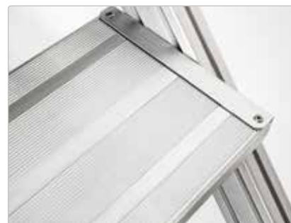
Stufenbelag Aluminium, gerieft